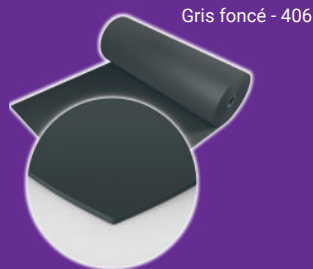
Gris foncé - 406